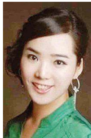
Il mezzosoprano Celeste Bang

Con inizio alle 17.30 il mezzosoprano coreano Celeste Bang, accompagnata al pianoforte dal Maestro Mario Sollazzo (che sostituisce l'indisposto Paolo Andreoli), si cimenta in un programma ricco e impegnativo, che tuttavia non mancherà di emozionare il pubblico, data la grande popolarità delle arie scelte: tema del concerto è infatti "L'Ottocento. Il belcanto e il melodramma". Celeste Bang ci porterà prima nello scoppiettante e brioso mondo rossiniano - con arie tratte da Italiana in Algeri - poi nel belcantismo di Bellini - del quale saranno cantate arie da Capuleti e Montecchi, Lucrezia Borgia - sino ad arrivare a Donizetti - La Favorita - e infine a Verdi, con il Don Carlo e Trovatore.