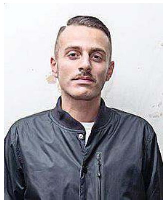
L'artista Ghemon all'Estatoff

RITORNA IL RAPPER GHEMON SUL PALCO DELL'ESTATOFF ■ Stasera, dalle 21, sul palco dell'Estatoff di via Morandi, a Modena, torna Ghemon, uno dei